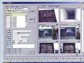
コンテナ管理システム

国際商品としての「古紙」の重要性が増しています。国際循環型のリサイクルでも、法令順守は勿論、国際商品としての品質管理が基本です。弊社ではトレーサビリティ(追跡可能性)を備えたシステムであるコンテナ管理システムを開発・運用しています。これにより、何時・何処から・何処へ・どのような物を・どのような状態で販売したのか、商品の履歴をトレースバックすることが可能です。