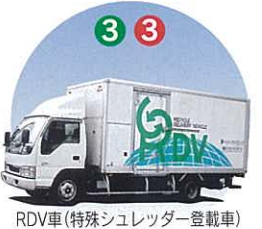
RDV車(特殊シュレッダー搭載車)