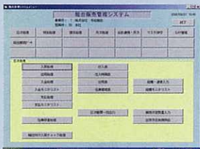
総合販売管理システム

(株)オービック社と共同でMetaFrame(メタフレーム)を活用した総合販売管理システムを開発・導入しています。高い汎用性・拡張性を持たせることにより状況変化に応じたシステム更新を容易に行なうことが可能です。また自社でデータセンターを整備して、あらゆる情報を蓄積しています。蓄積した全ての情報を分析し、業務全体の改善に活用します。