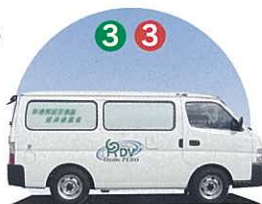
ZERO車(電子データ消去マシン搭載車)